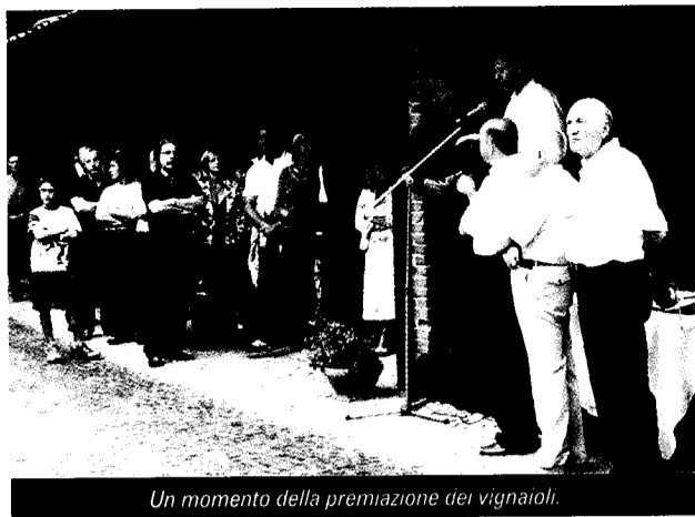
Un momento della premiazione dei vignaioli.

Segue articolo: "Concorso degustazione vini del Roero" a pag. 1